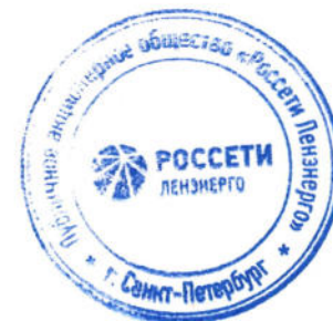
ГРАФИК временного отключения потребления на 2024/2025гг. по ПАО "Россети Ленэнерго" на территории г. Санкт-Петербурга