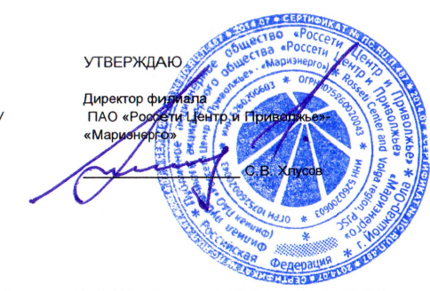
ГРАФИК ограничения режима потребления электрической мощности на 2024/2025 гг. по филиалу ПАО "Россети Центр и Приволжье" - "Маризэнерго" на территории Республики Марий Эл