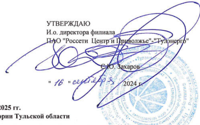
ГРАФИК временного отключения потребления на 2024-2025 гг. по филиалу ПАО "Россети Центр и Приволжье"-"Тулэнерго" на территории Тульской области

УТВЕРЖДАЮ И.о. директора филиала ПАО "Россети Центр и Приволжье" - "Тулэнерго"